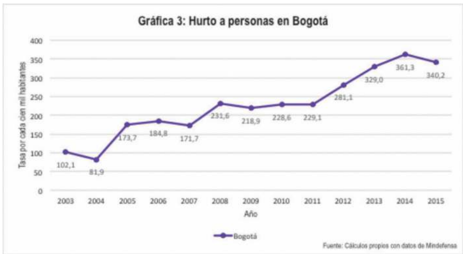
Figura 3. Variación de la tasa de hurtos por 100 mil habitantes en Bogotá

bierno de la ciudad para atender las problemáticas de la seguridad ciudadana, en primer lugar, porque con su aparición se elevan a primer rango de prioridad las problemáticas relacionadas con la lucha contra la criminalidad, así como las políticas y programas relativos a la seguridad ciudadana, que en el modelo anterior se encontraban en una subsecretaría de segundo nivel adscrita a la Secretaría Distrital de Gobierno y en el Fondo de Seguridad y Vigilancia, una entidad encargada de dotar a las autoridades de los elementos necesarios para el cumplimiento de su labor, sobre la que existen serios cuestionamientos sobre la transparencia en su contratación.