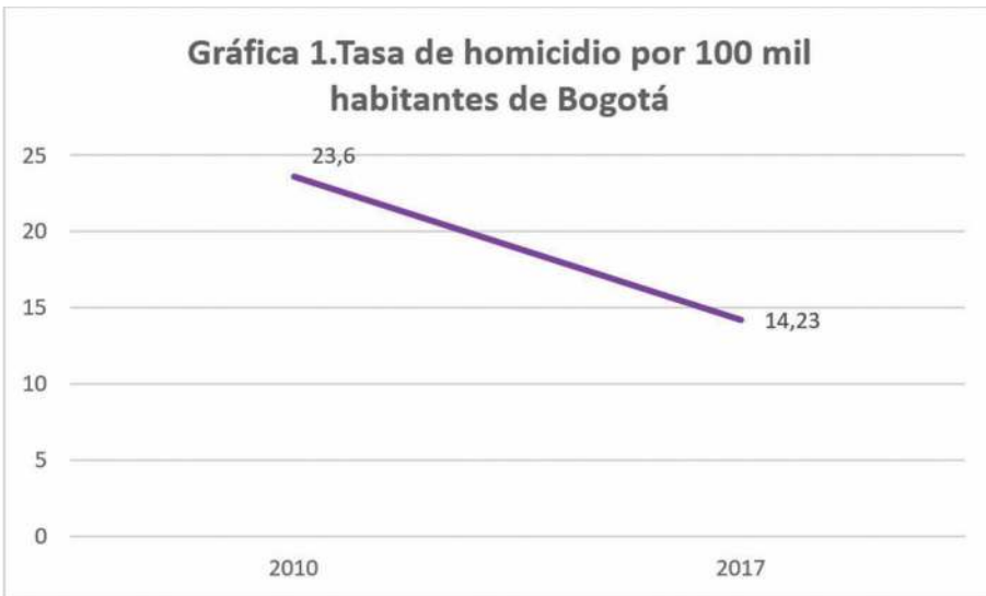
Figura 1. Variación de la tasa de homicidios por 100 mil habitantes en Bogotá (Elaboración propia con datos de Medicina Legal)

La variación en la tasa de homicidios por 100 mil habitantes consti-